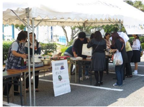
PTAによる物品・食物バザー