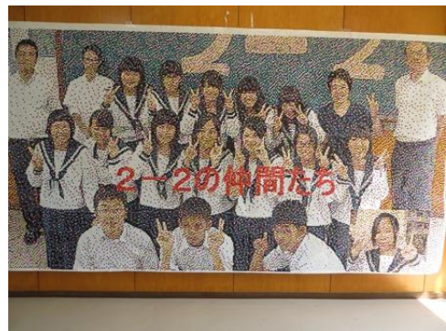
2年2組は学級写真のモザイクアートです