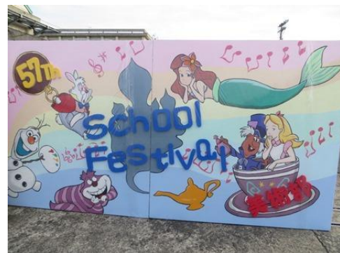
美術部作成の看板