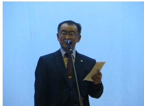
教頭先生による講評