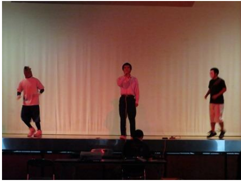
3年有志シンセサイザーのダンス