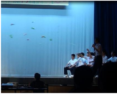
1年生男子による「バカッコイイ日常」