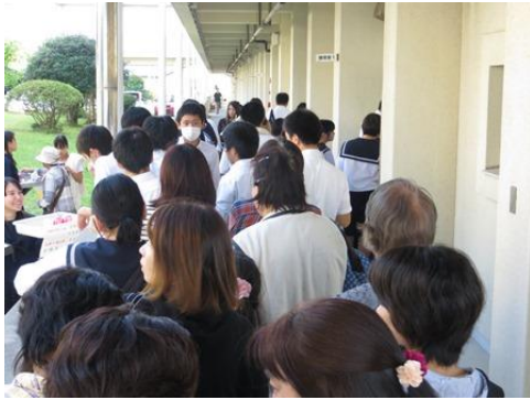
3年生による食物バザーは今年も盛況でした