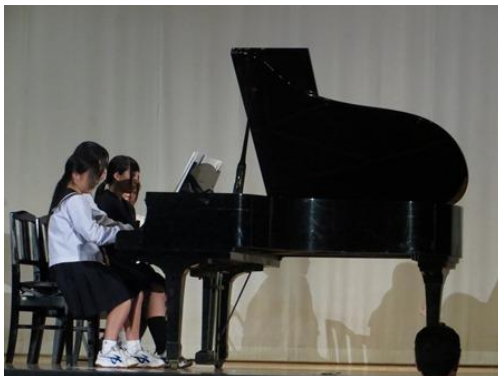
3年生の音楽選択者によるピアノ連弾