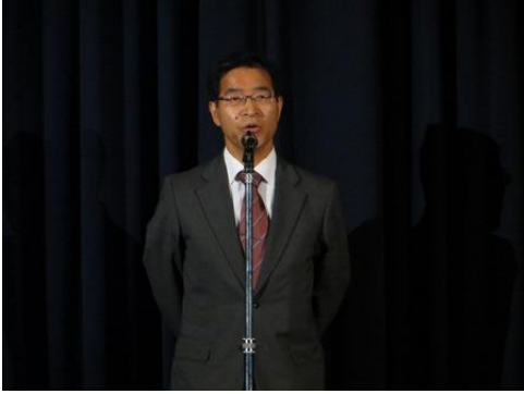
学校長のあいさつで文化祭が始まりました。