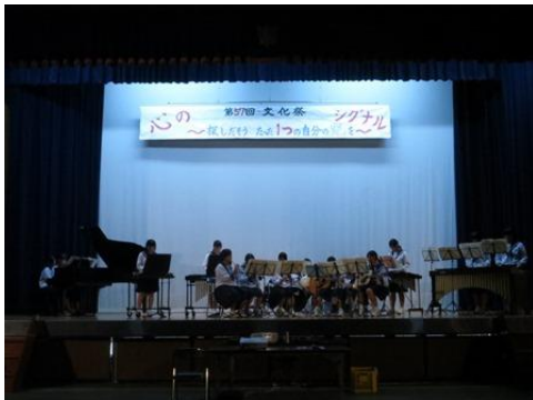
2年生の音楽選択者による合奏