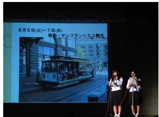
米国サリナス市でのホームステイ体験発表