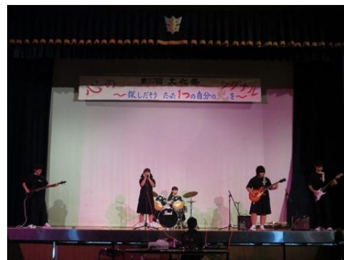
軽音楽同好会の発表