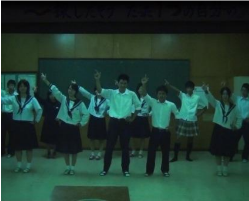
生徒会作成のVTRによるオープニング