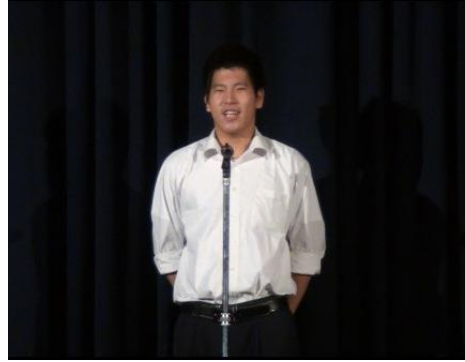
文化祭実行委員長挨拶