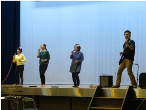
吹奏楽部の特別ゲスト①