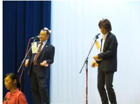
吹奏楽部の特別ゲスト②