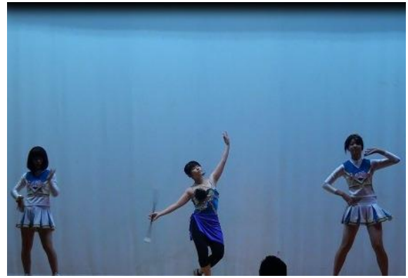
1年生有志によるバトン&チアリーディング