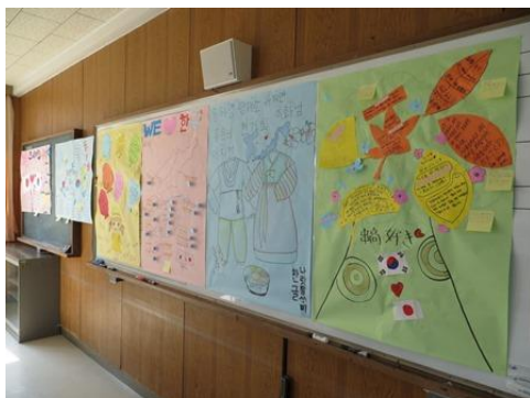
韓国高校生からのメッセージ