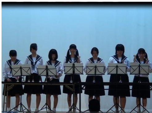
1年生の音楽選択者によるハンドベル