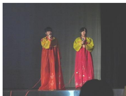
ハングル同好会による韓国語の歌披露