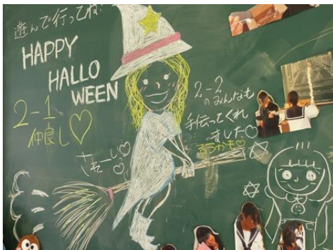
2年1組は縁日をテーマとした展示です