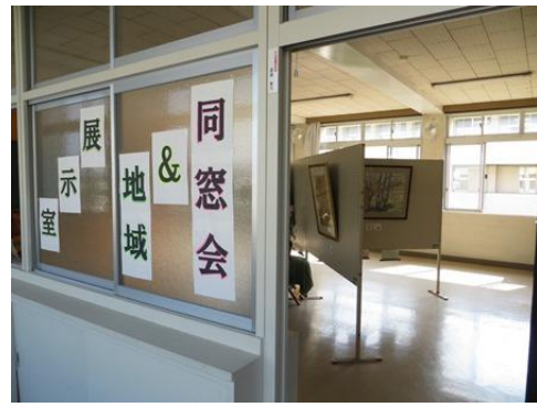
地域・同窓会展示