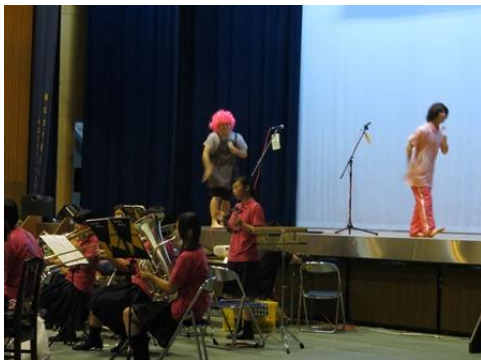
吹奏楽部の特別ゲスト③