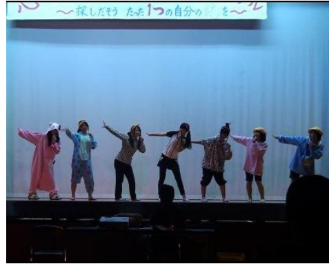
1年生女子によるダンス披露