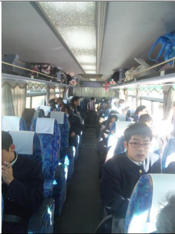
バスで空港に移動します。 11:31