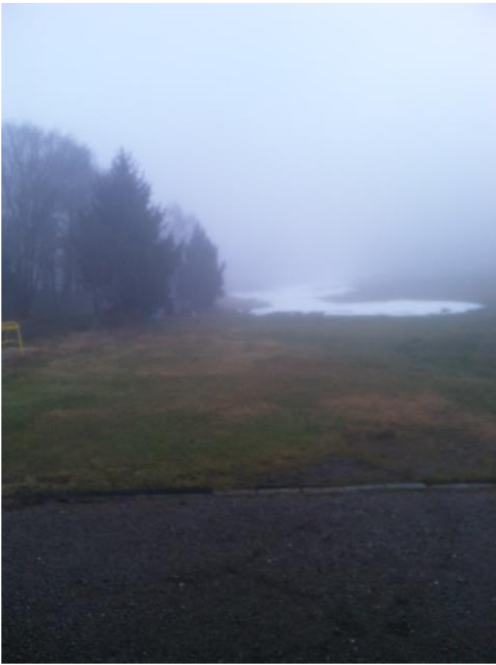
今朝の菅平の様子。雪がありません。 06:48