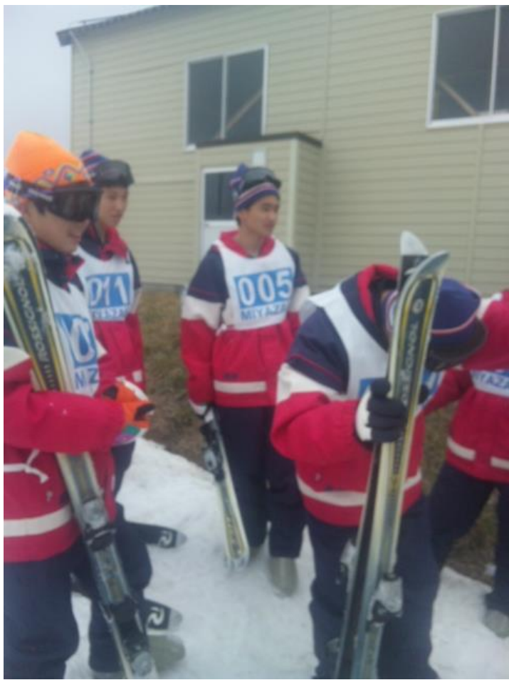
リフトを待っています。 15:04