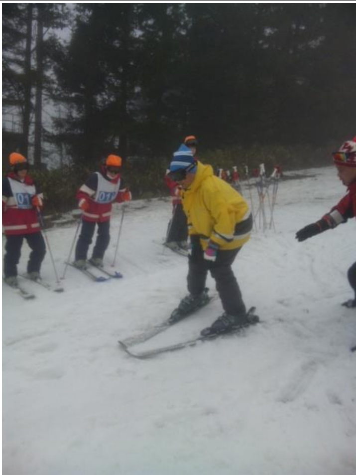
教頭先生の雄姿です。 17:20