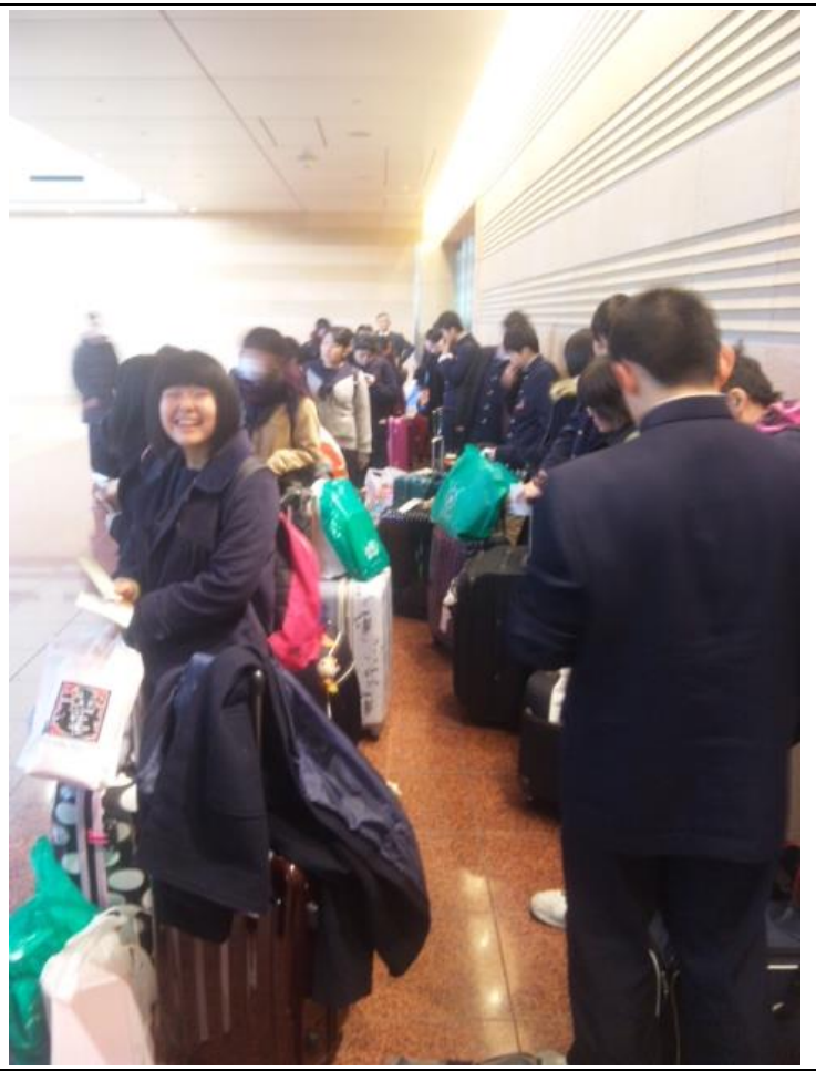
羽田に到着しました。 12:06