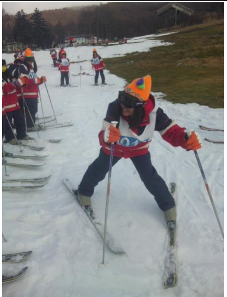
恐る恐る滑っています。 10:18