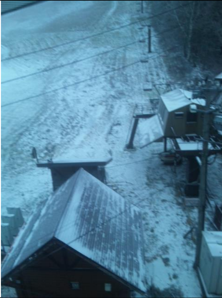
旅館からの風景。雪景色です。 06:58