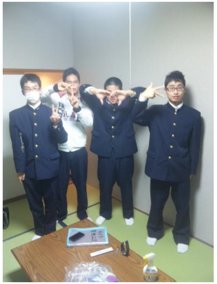
宿泊地に到着です。 17:59