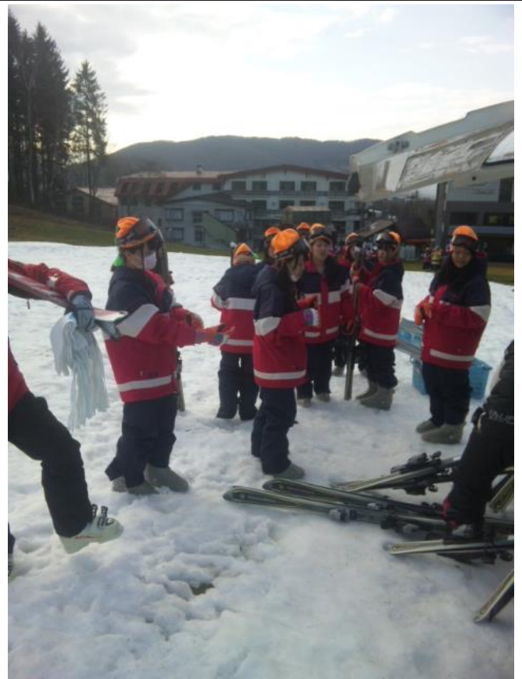
うまく滑ることができるかな? 08:56