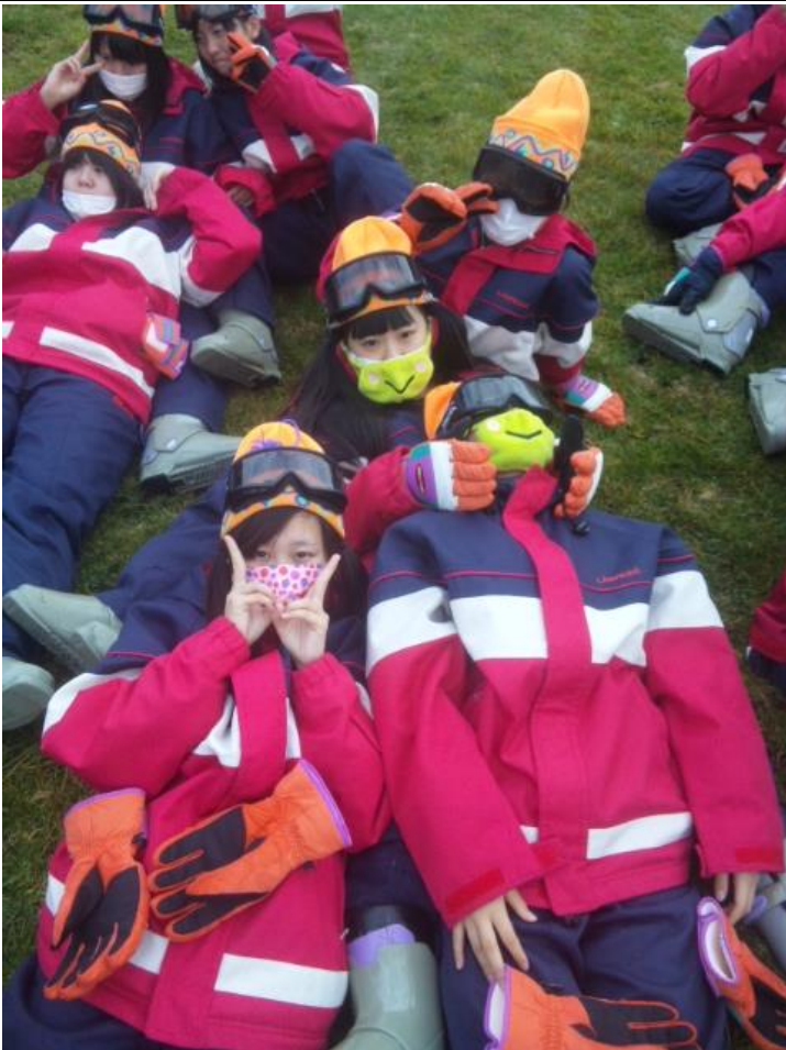
スキー体験が始まりました。 08:42