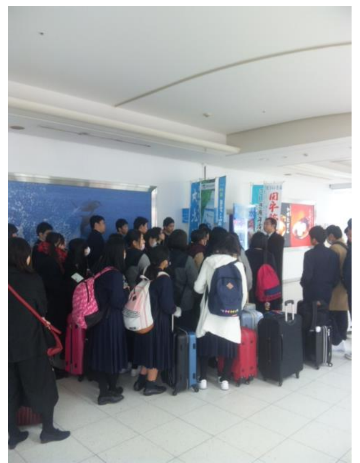
教頭先生の話聞く生徒たち。 8:45