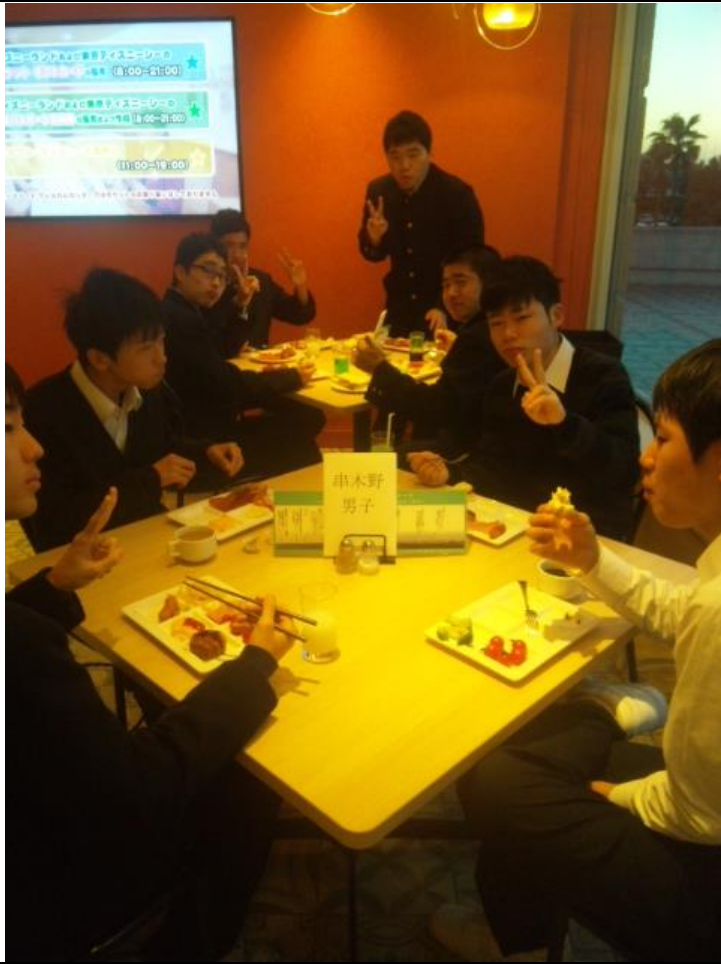
ホテルでの朝食です。 06:49