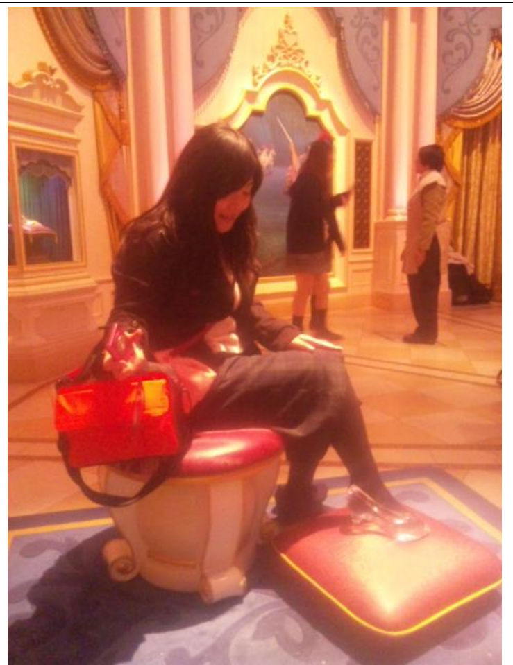
なかなか生徒の姿を 14:09