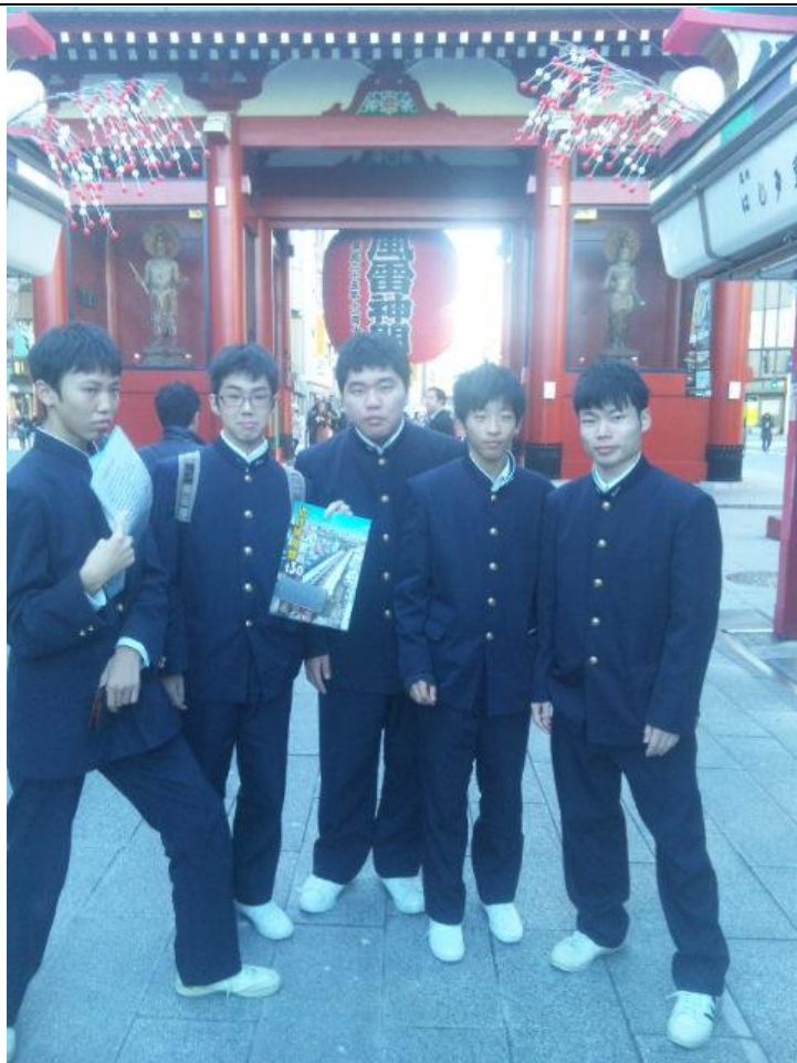
浅草寺を観光しています。 08:37