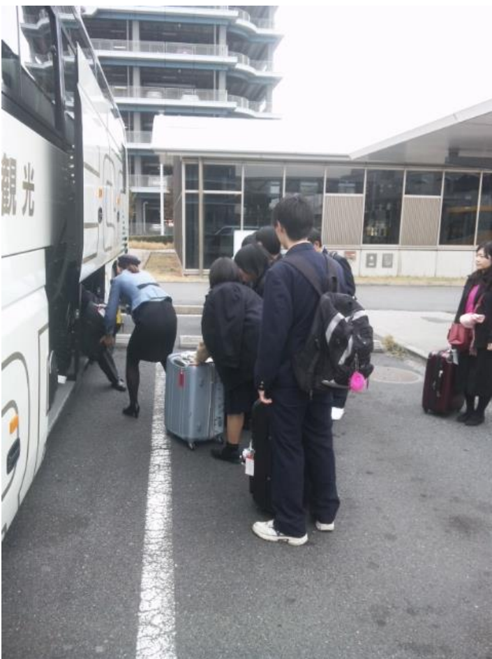
羽田に到着しました。11:52