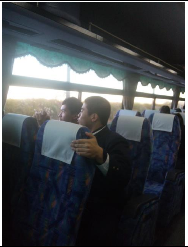
バスで都内観光に向かいます。 07:41