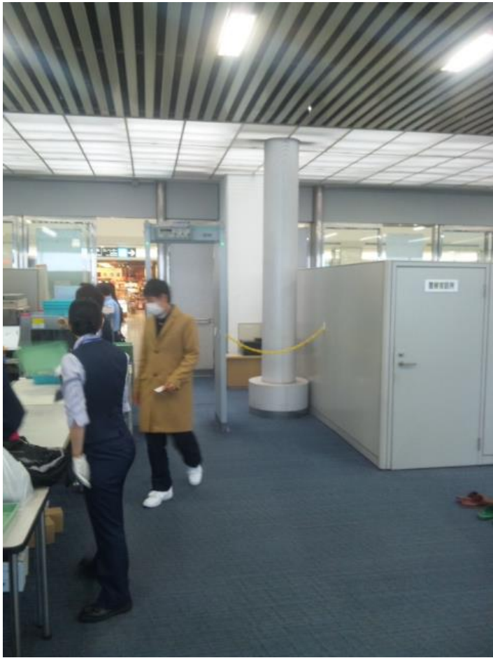
搭乗ゲートに向かいます。9:02