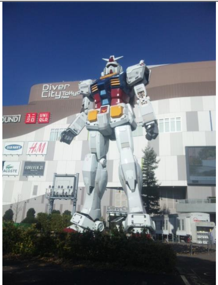
お台場に来ました。 10:14