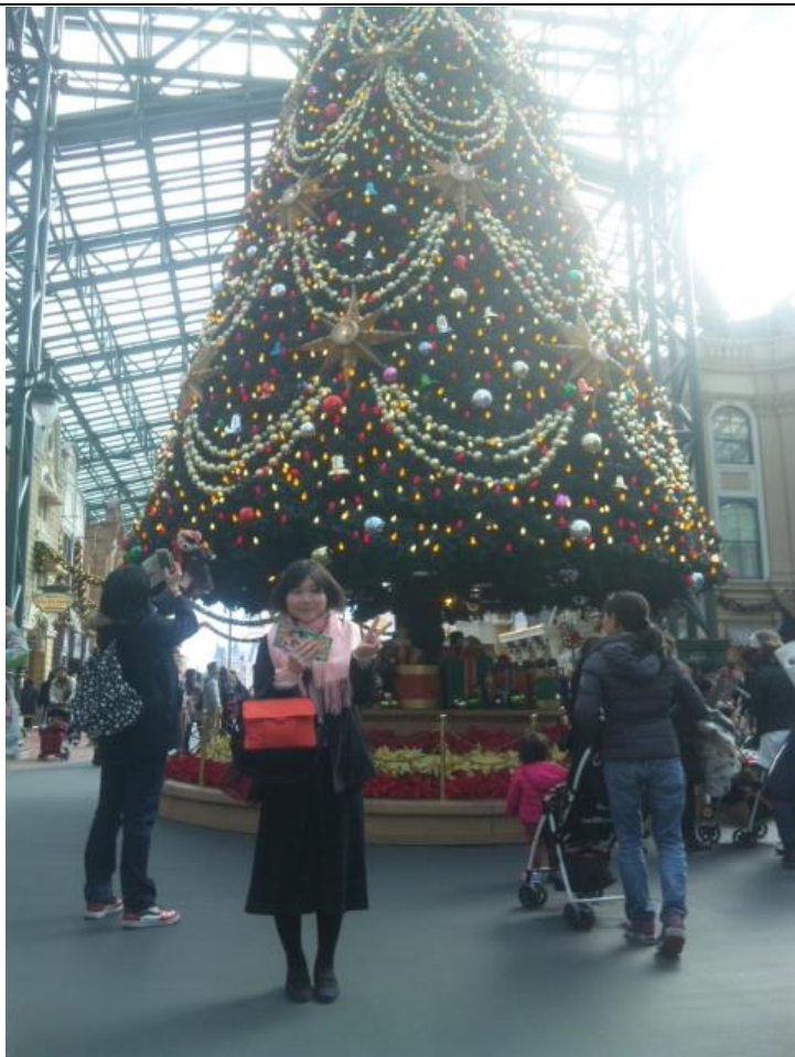
ディズニーランドは広くて 12:54