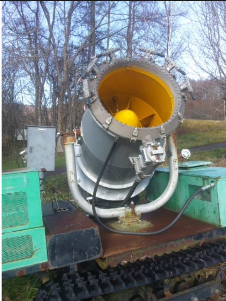
雪を作る人工降雪機です。 08:58