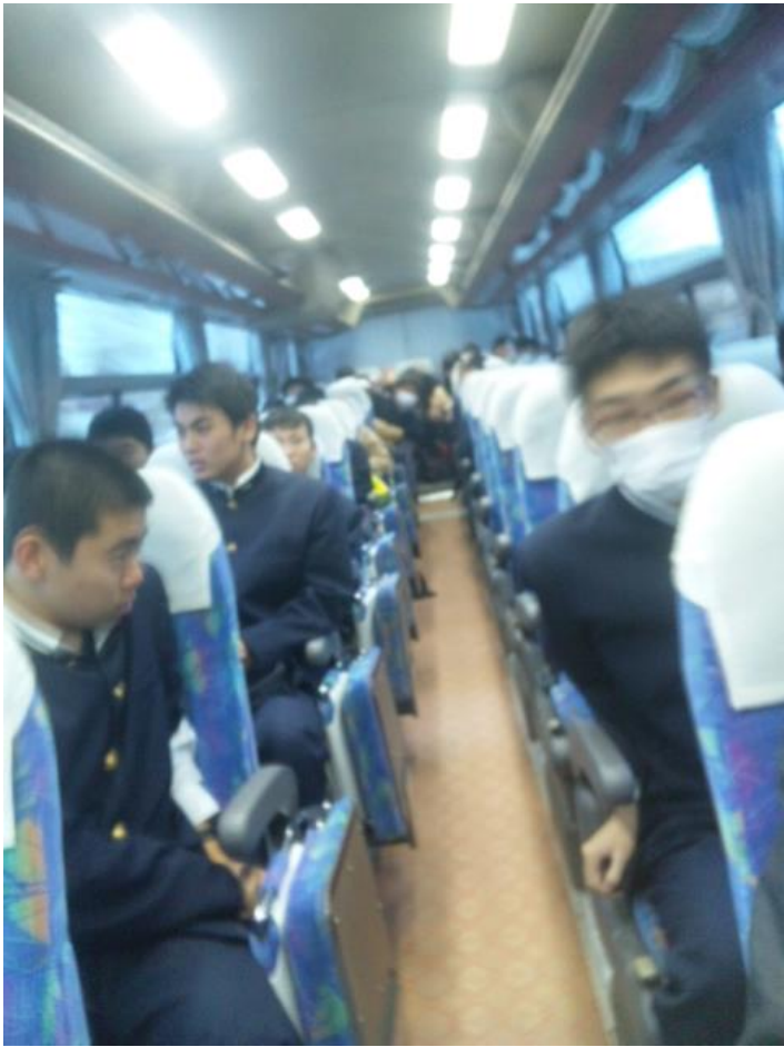
鹿児島空港へ向かうバスの中 7:35