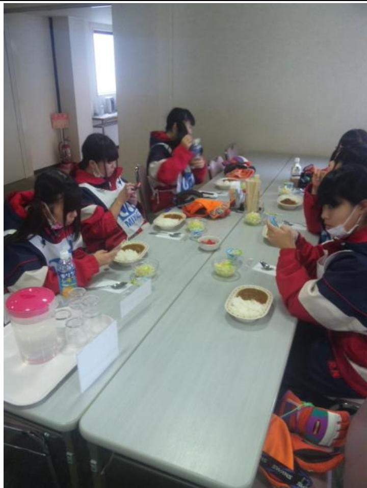
昼食はカレーライスです。 12:10