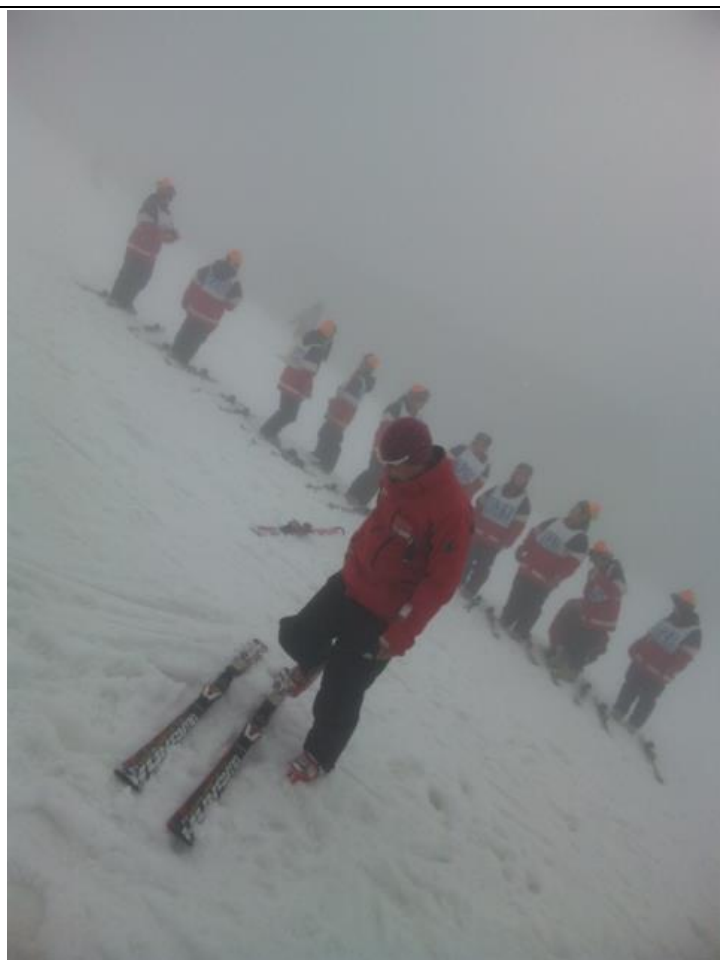
一転して雪景色のようです。 13:46