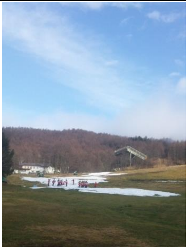
雪が少ないのが残念。 10:36