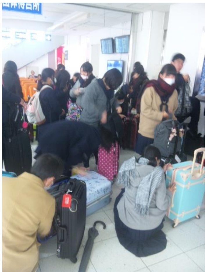
空港で荷造りをやり直しています。 8:38