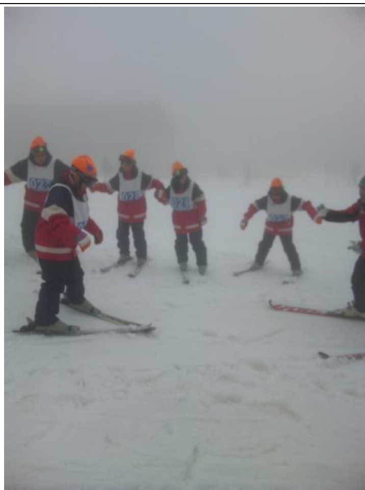
スキーらしくなってきました。 13:53