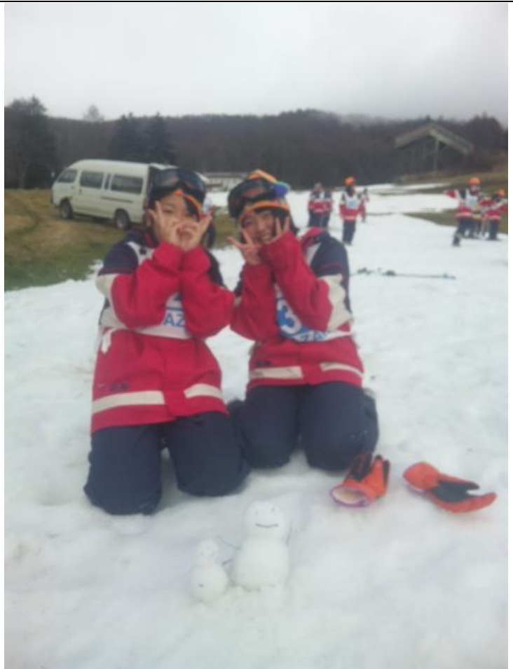
午前の部が終了しました。 11:48