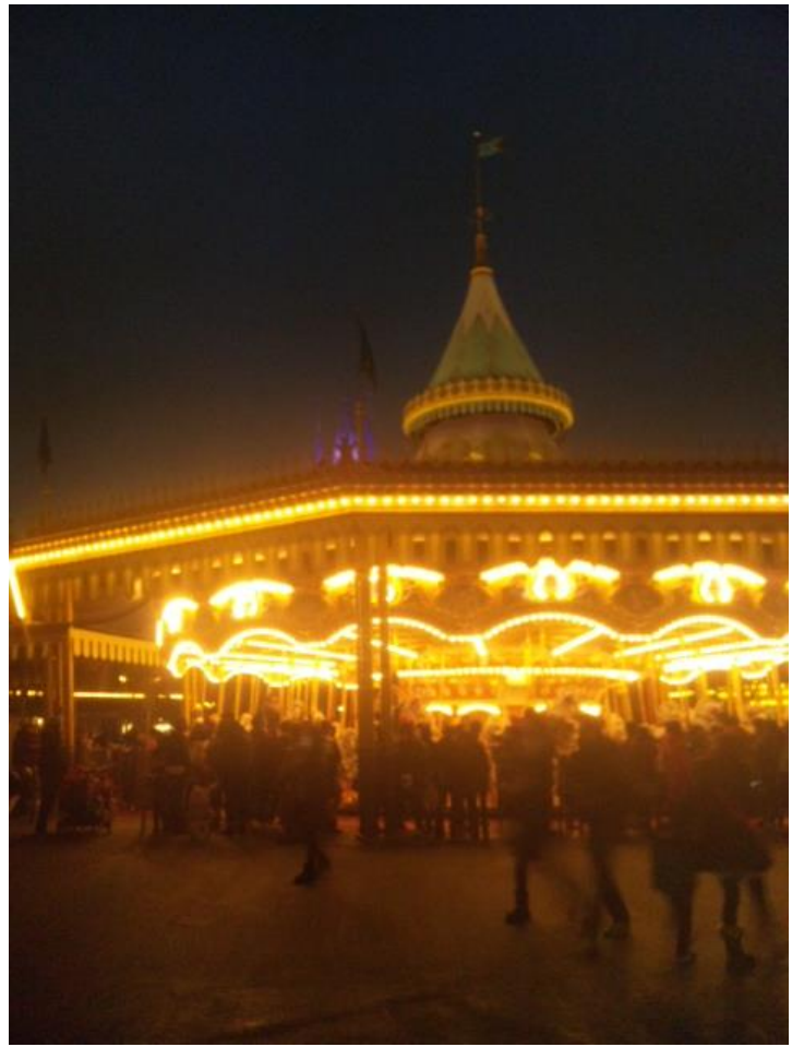
出来ないようです…。 17:04