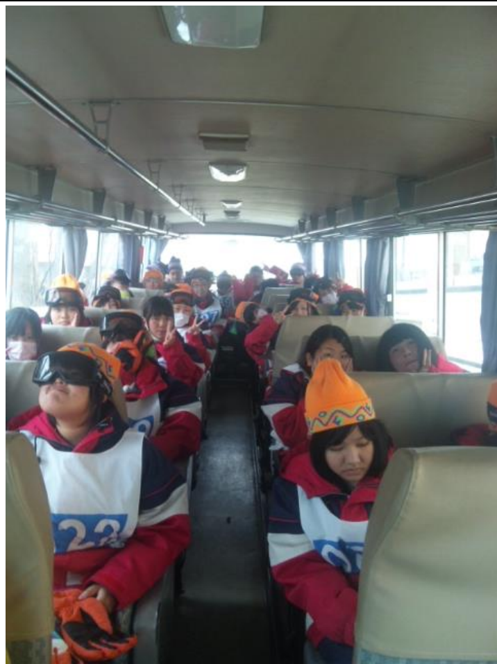
スキー体験午後の部に向け、バスで移動します。 13:21