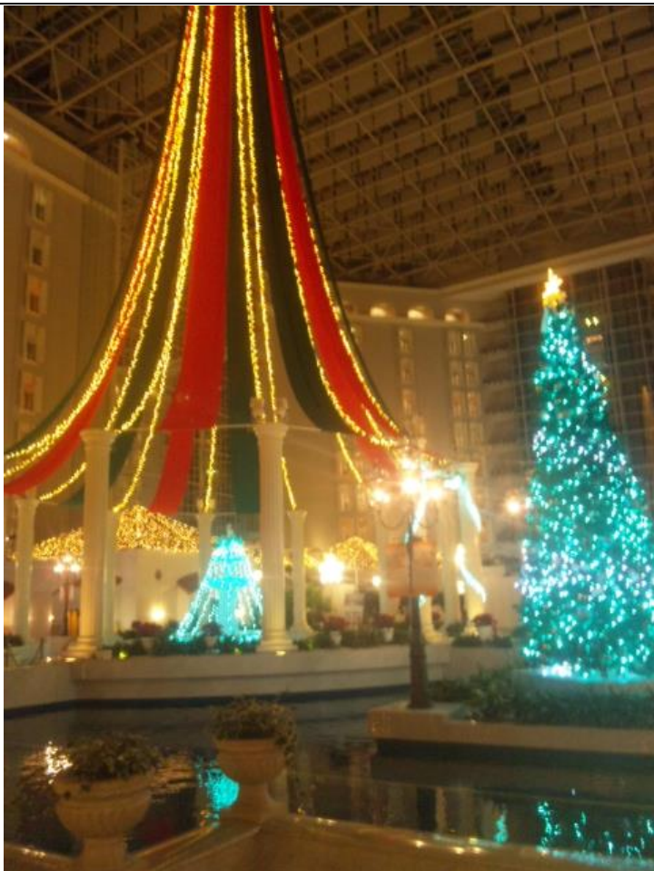
ホテルには巨大なツリーが飾られています。 19:44