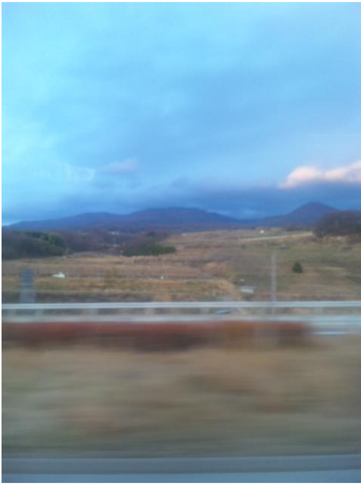
バスの車窓から。雪が全く無いようです。 16:14