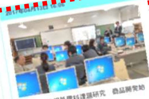
商業科・情報処理科課題研究 商品開発始 動！