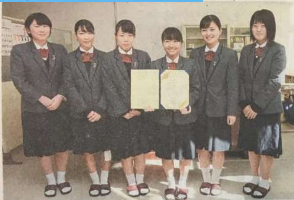
民泊事業を提案した鹿児島南高校生 ＝鹿児島市の同校

離島の空き家 民泊活用企画 鹿南高生が表彰 日本政策金融公庫主 催の「高校生ビジネス プラン・グランプリ」 で、鹿児島南高校が提 案した事業が上位10 0件に選ばれた。15日、 同校で表彰式があっ た。