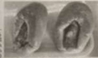
①風月堂で販売する抹茶を使ったケーキ②たわわタウン谷山で販売予定の焼き芋プリン