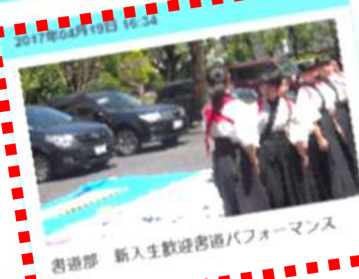
書道部 新入生歓迎書道パフォーマンス