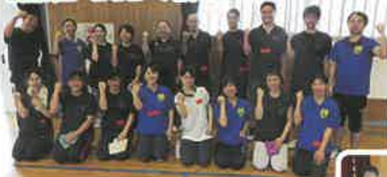
優勝は2-2&2-7合同チーム