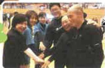
チームワークは バツキ!

12月4日(日)に、串良平和アリーナにて毎年恒例の市P連ソフトバレーボール大会が行われました。本校からは、7月の校内ミニバレー大会で優勝した2年2組と7組の合同チームが参加しました。PTA係の先生方も参加し、また校長先生・教頭先生も応援に駆けつけてくださり、力を合わせて全カプレーで戦いました。その結果、見事予選リーグを突破!決勝トーナメントへ進み、ベスト8の成績を残すことができました。