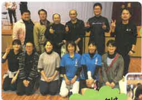
来年こそは 優勝するぞ!