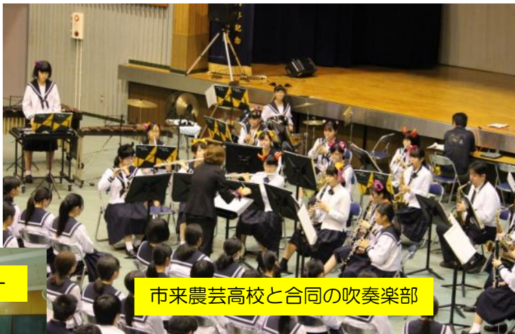
市来農芸高校と合同の吹奏楽部