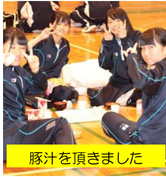
豚汁を頂きました

十一月十七日(金)、歩こう会を実施しました。串高を出発して冠嶽を回る、総距離二十三キロを歩いて踏破します。あいにく小雨も降る寒い天候となりましたが、日頃の鍛錬の成果を発揮し、参加した生徒全員が制限時間以内にゴールできました。 保護者の皆さまには、今年も豚汁とおにぎりの炊き