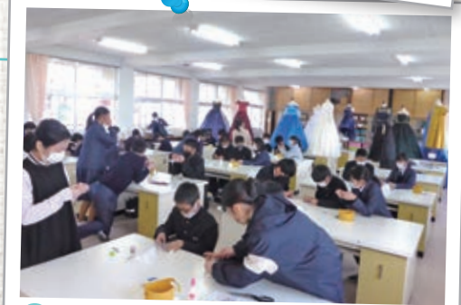
8月 中学生体験入学