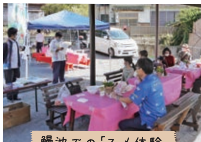
鰻池での「スメ体験」