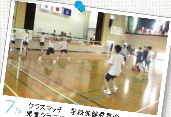
7月 クラスマッチ 学校保健委員会 児童クラブとの交流会