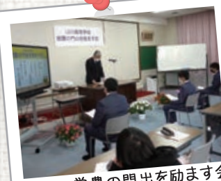
2月 営農の門出を励ます会 針供養 同窓会入会式