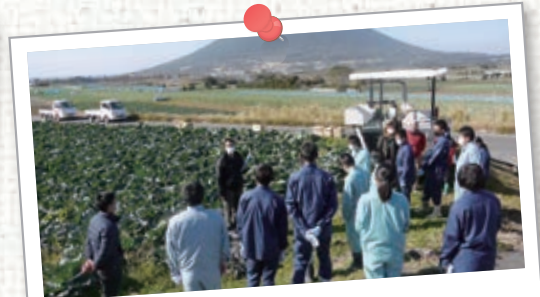
1月 スマート農業体験