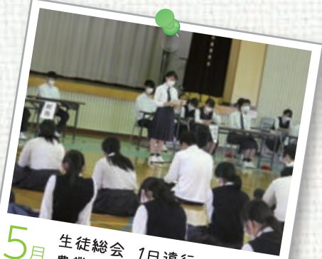
5月 生徒総会 1日遠行 農業クラブ・家庭クラブ総会 折鶴配布運動