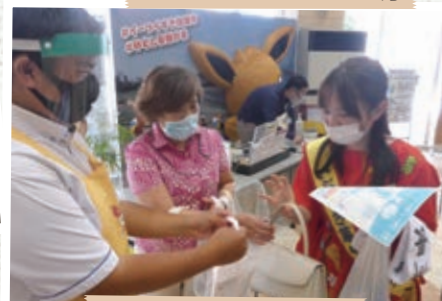
アロハ献血ボランティア