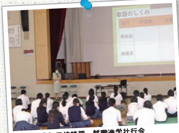
9月 3年面接練習 就職進学壮行会 インターンシップ 進路ガイダンス