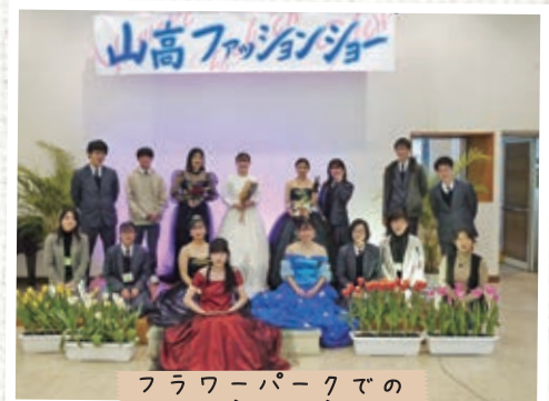
フラワーパークでの ファッションショー