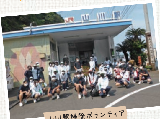
山川駅掃除ボランティア