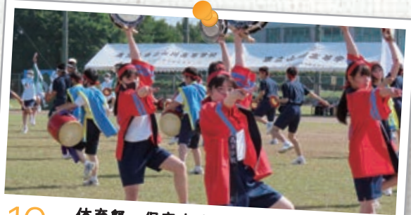
10月 体育祭・保育交流会 防災避難訓練 折鶴配布運動