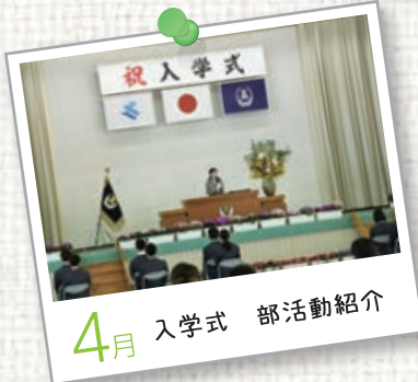
4月 入学式 部活動紹介