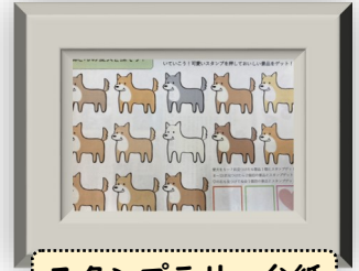
スタンプラリー台紙

一日遠足を全校生徒で行いました。この日は晴天に恵まれ、西郷さんも利用したと言われる「鰻温泉」に初めて行きました。学校から約3キロの場所にあり、途中スタンプラリーを行いながら1時間程度かけて行きました。鰻温泉では、卵と山川高校産の空豆を持参して、「スメ体験」を行いました。