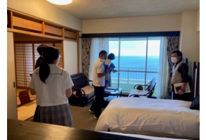
指宿ロイヤルホテル