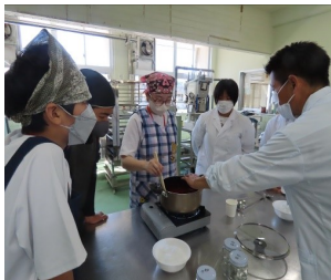
すももジャム作り

園芸工学・農業経済科では、オクラの収穫、ジャム作り、寄せ植え・コケ玉作り、農業機械操作、生活情報科では、商業科系でゲーム形式の金融を学び、家庭科系で味噌玉作りを行いました。参加した中学生は、多彩な体験ができ、作ったものをお土産として持ち帰りました。アンケートでは「高校のイメージが深まり、興味が持てたので入学したいと感じた。」「楽しかった。」「体験入学を通して安心感を得た。」などの回答があり、ほとんどの中学生が体験入学に満足していました。