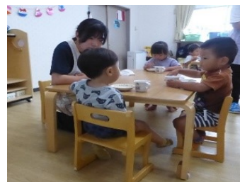
保育ボランティア