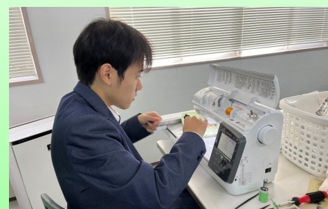
デジタルミシンを使う様子