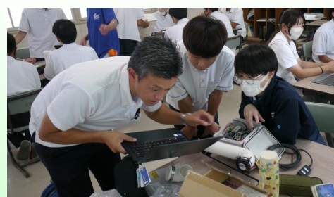
センサーを組み立てる様子

生活情報科は、デジタルミシンを活用しておもてなしのノベルティグッズの作成とVRゴーグル、ゴープロカメラを活用して学校のPRと地域の魅力発信に取り組んでいます。