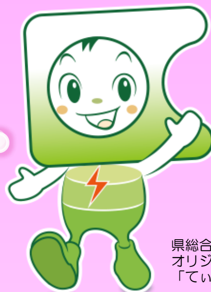
県総合教育センター オリジナルキャラクター 「ていらん」