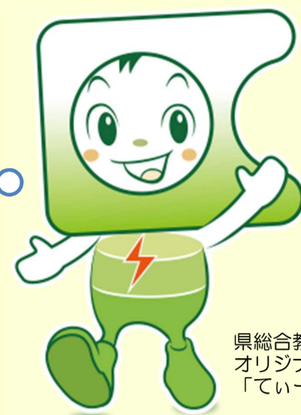
県総合教育センター オリジナルキャラクター 「ていらん」