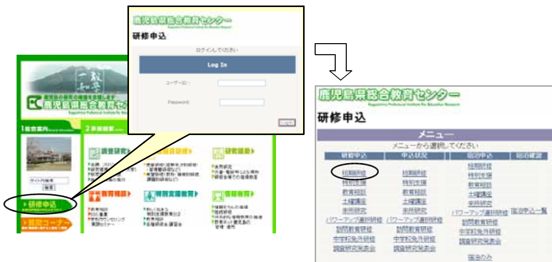
図 Webサイトのメニュー画面