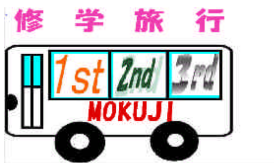
表紙)これから3日間の思い出が始まる。