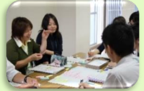
訪問教育等担当教員研修会