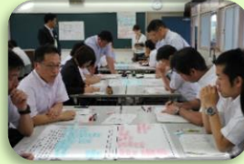
経験者教頭研修会