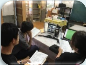
テレビ会議システム