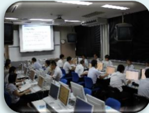
情報教育に関する研修