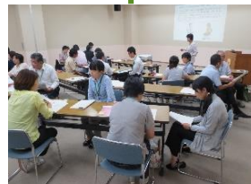
教育相談・教職員支援