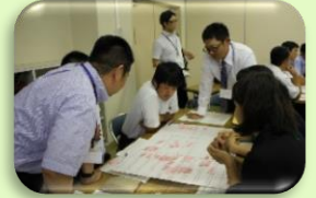
パワーアップ研修