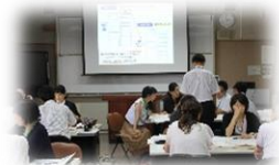
ステップアップ研修