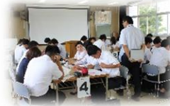
パワーアップ研修