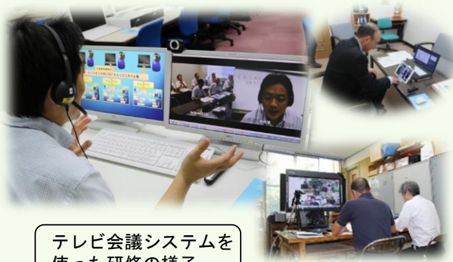
テレビ会議システムを使った研修の様子