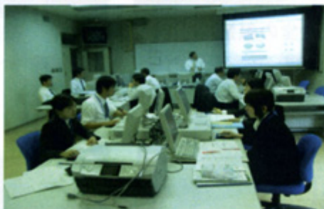
第1回「HP作成ソフトの基礎」の研修