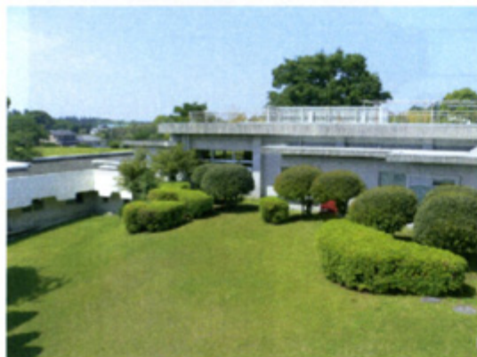
宿泊室からの眺望