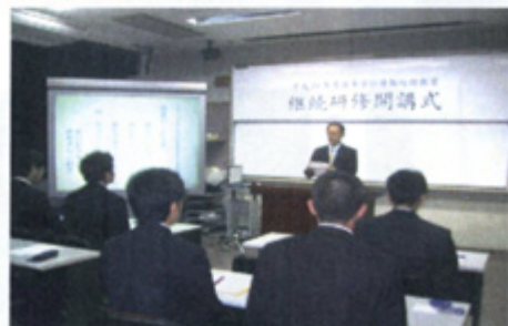
開講式での「研修者代表あいさつ」