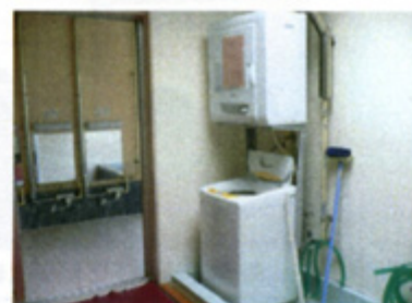
浴室の洗濯機と乾燥機