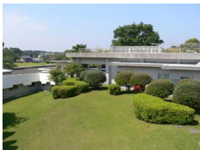
宿泊施設からの眺望