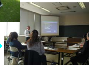
初めての特別支援 教育コーディネーターのための 実践講座

土曜講座の申込みは、教育センターWebサイトまたはFAXで、開設日の一週間前までに行ってください。申込みと同時に受講決定となります。