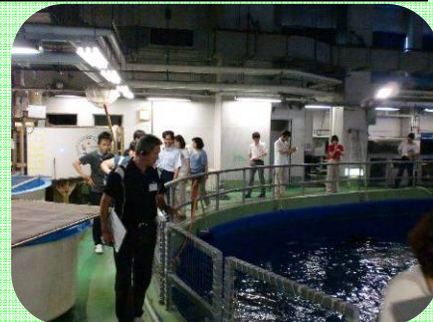
黒潮大水槽のバックヤード見学