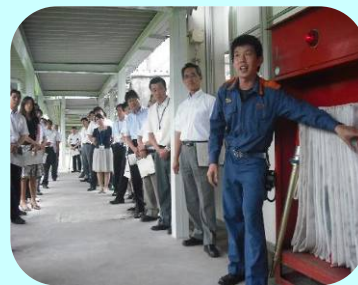
屋外消火栓の取扱い講習

鹿児島市消防局吉田分遣隊の指導の下、火災を想定した避難訓練と救急救命の実技訓練を行いました。