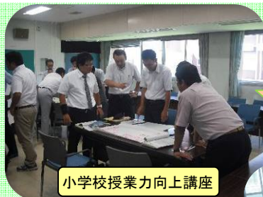
小学校授業力向上講座