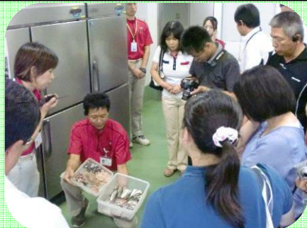
給餌についての説明