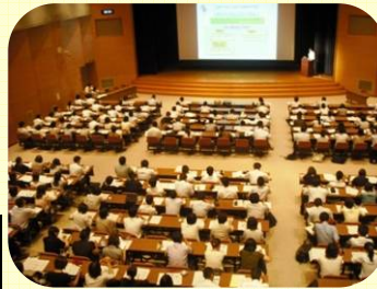
共通研修 【教育政策の動向】 大原台講堂