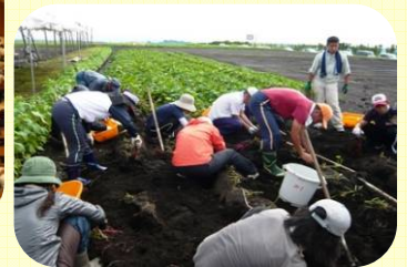
講座選択研修 【食と農の指導者研修】 県立農業大学校開設講座