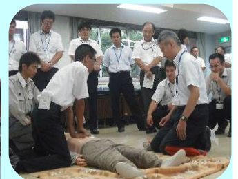
人形を使って心臓マッサージやAEDの取扱い方の訓練