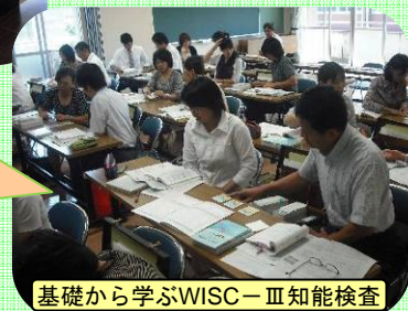
基礎から学ぶWISC-Ⅲ知能検査