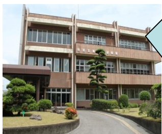
【特別支援教育研修棟】

特別支援教育研修棟では、特別支援教育に関する研修講座や知的障害・発達障害などについて、電話や来所による教育相談を行っています。