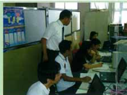
【校内研修会：情報教育】