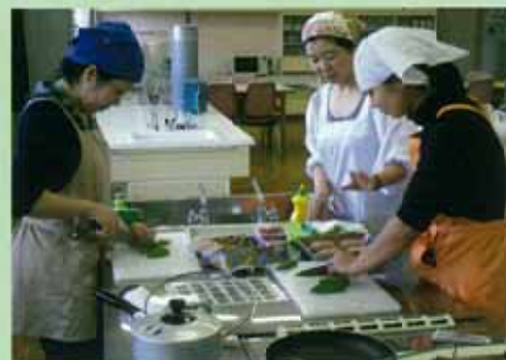
【初めて家庭科を指導する教員のための講座】

県総合教育センターのWebサイト又は各学校に配布してある開設一覧を御覧ください。平成20年度は、6月末までに30講座に274人が受講しています。 なお、第Ⅱ期（9月～12月）は、8月中旬に開設一覧を配布する予定です。