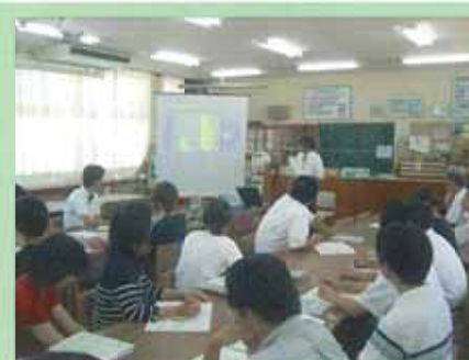
【校内研修会：特別支援教育】