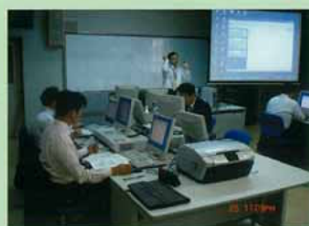
【学校ホームページ作成基礎】