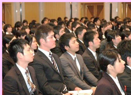
フレッシュ研修 (初任校:1年目研修)