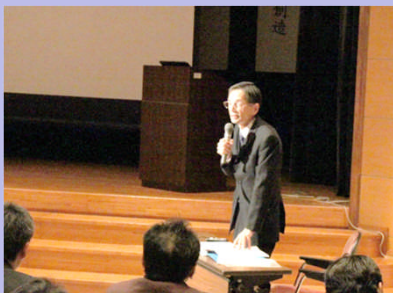
大学の先生によるコメント