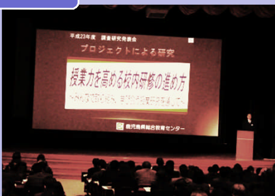
「プロジェクトによる研究」の発表