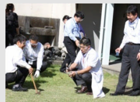
科学的な思考力、表現力をはぐくむ理科講座

全132講座を開設し、前期・後期に分けて募集します。本年度は新たに「基礎・基本」定着度調査を指導法改善に生かす講座や、高校対象の講座をそれぞれ5教科で実施する予定です。