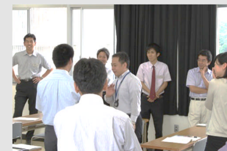
「心をひらく生徒指導力向上講座」 -不登校対策1組-