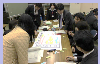
ワークショップ型研究協議 (第8分科会: 教育相談)