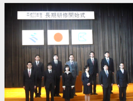
平成23年度長期研修開始式

期間 1年間(4月~3月) 平成24年度研修予定者: 小・中・高・特別支援 学校の教員11人