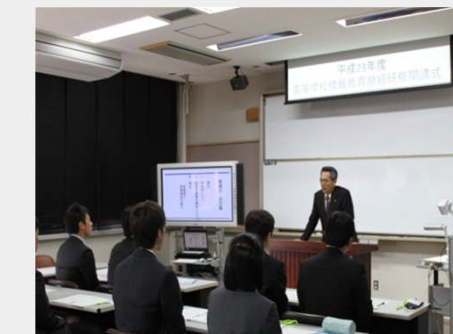
平成23年度継続研修開始式

期間 年間19回 (5月~2月の金曜日) 平成24年度研修予定者: 高等学校の教員11人