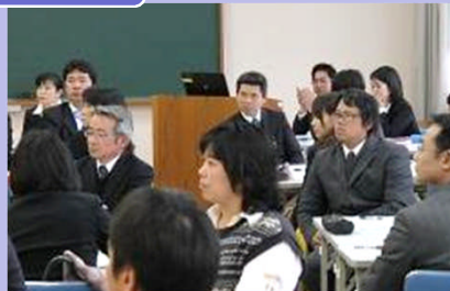
研究協議 (第1分科会: 国語科)