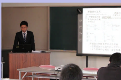
研究協力員による事例発表 (第2分科会: 社会・地歴・公民科)