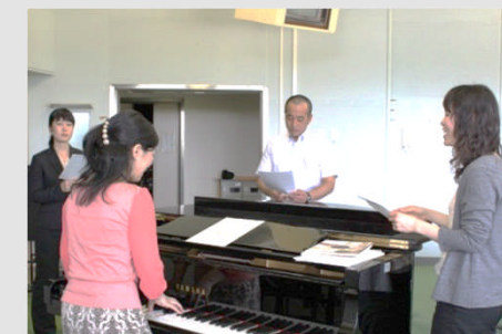
「中学校免許外教科担任教員等研修会」音楽講座