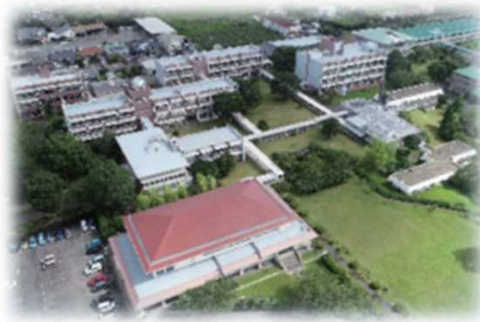
【鹿児島県総合教育センター全景】