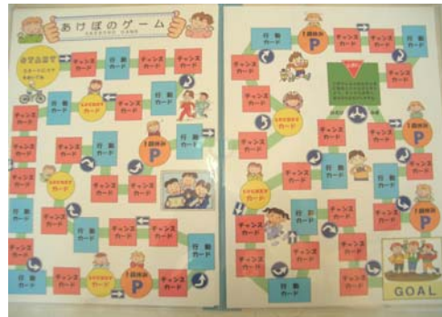
図3 自作のソーシャルスキルすごろく

次項の学習指導案の中で活用したソーシャルスキルすごろくは、一人一人の幼児児童生徒に合わせて作成したカードを引いて、カードの質問に答えられたらさいころを振り、出た目の数だけコマを進めるゲームである(図3)。カードの内容や全体的なルールは対象となる幼児児童生徒に合わせて柔軟に変更できるため、興味をもって取り組みやすい。今回は、自作のすごろく盤を使用するとともに、児童が日常生活で実際に経験した内容のカードを作成し、具体的場面をよりイメージしやすいように工夫した。