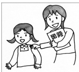
図2 肩をたたいて呼ぶ

たたくなどの合図 (図2)をして、 相手が気付いてか ら、顔を見て 読話(相手の唇 を読む)しやすいようにする。