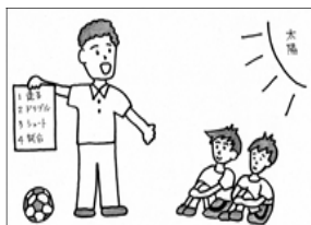
図3 屋外での説明方法

ときには、太陽に背を向けた位置に児童を座らせ（図3）、活動の内容と競技のルールを画用紙に書き、ジェスチャーを付けて説明をすることで、A児は、ルールの内容を把握し、自分から競技に参加できるようになってきた。