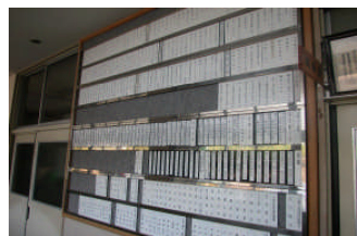
過去の進路実績掲示板(職員室横)。将来自分の進路が掲示されるか？