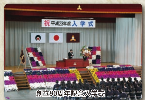
創立90周年記念入学式