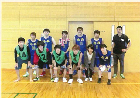
■ 平成29年度自治連体育大会 (バスケットボール)