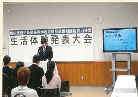
■ 県生活体験発表大会