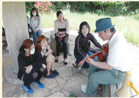
■ 新入生歓迎一日遠足