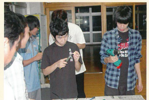
■ C P (総合的な学習の時間)