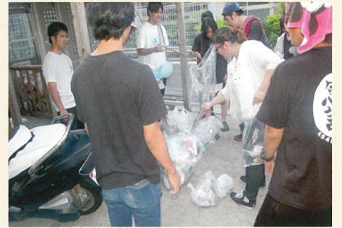
■ ボランティア清掃