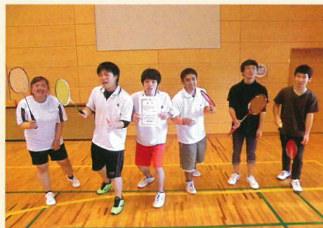
■ 平成29年度自治連体育大会 (バドミントン)