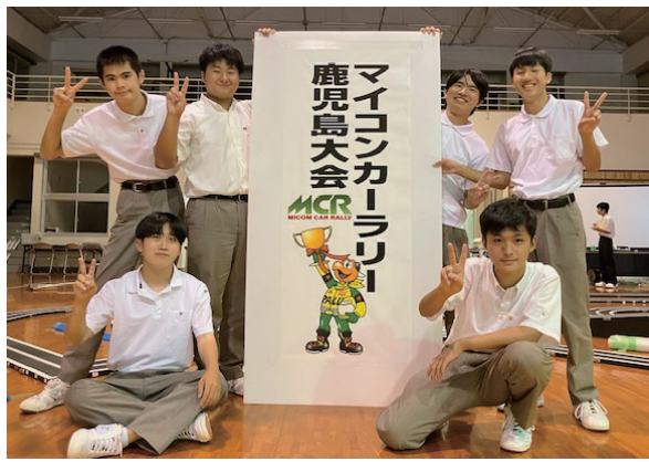
県大会終了後、みんなで記念撮影！九州大会もがんばります！

【大会報告】工業技術研究部 マイコンカーラリー県大会 10月7日(土) 加治木工業高等学校において開催された「第23回マイコンカーラリー鹿児島県大会」に、工業技術研究部6人が出場しました。 マイコンカーラリーとは、ロボット競技大会の一つであり、マイコンを搭載したロボット(模型自動車)が、コースを自律制御(ロボット自ら動く方式)で走り、タイムを競う競技です。 結果は、カメラクラスで一位、ベーシッククラスで四位、五位に見事入賞！この3人が11月18日(土)から沖縄県立未来工科高等学校で行われる九州大会に出場します。強豪ぞろいの九州大会ですが、日頃の研究成果を発揮し、上位入賞目指して頑張ってきてくれることを期待しています！