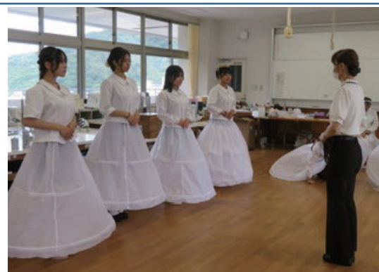
デザインから作り上げたドレスを披露するために、真剣に取り組みました。

美容に関する職業について教えていただいたり、実技講習では編み込みやそのアレンジの方法を体験したり、自分の進路を考える上での参考になりました。