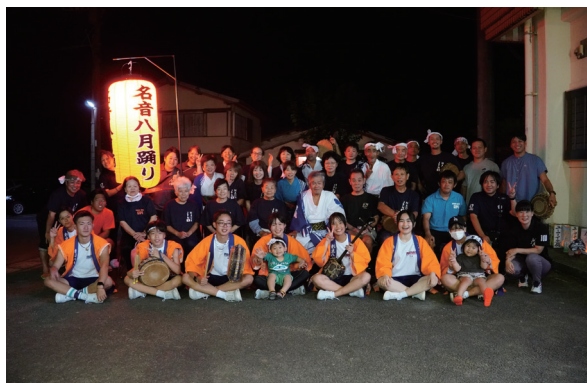
大和村名音集落の皆様と一緒に。貴重な経験となりました。八月踊りを次の世代へつないでいきましょう！

燃ゆる感動かごしま国体閉幕 運営協力委員として参加 10月13日から3日間、「特別国民体育大会燃ゆる感動かごしま国体奄美群島日本復帰70周年記念相撲競技大会」が、奄美市名瀬運動公園サードームで開かれました。 鹿児島で開催される国体は、51年ぶりということ、皆さんの保護者も初めて体験するという方が多かったのではないのでしょうか。 そんな貴重な国体の運営補助員として、奄美高校生15人も大会運営に協力しました。皆、自ら立候補して参加してくれました。地域はもちろん島外から訪れた多くの方々と触れ合うことで、考え方や行動に刺激を受けると同時に翻って自分を見つめ直す機会にもなったことと思います。休日返上の3日間は体力的にもきつかったかと思いますが、あなたの未来を支える生きる力を育んだ濃密な時間となったことと思います。