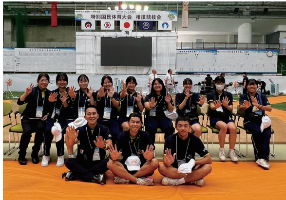
3日間運営補助員として、サポートを行いました。

【大会報告】工業技術研究部 マイコンカーラリー県大会 10月7日(土) 加治木工業高等学校において開催された「第23回マイコンカーラリー鹿児島県大会」に、工業技術研究部6人が出場しました。 マイコンカーラリーとは、ロボット競技大会の一つであり、マイコンを搭載したロボット(模型自動車)が、コースを自律制御(ロボット自ら動く方式)で走り、タイムを競う競技です。 結果は、カメラクラスで一位、ベーシッククラスで四位、五位に見事入賞！この3人が11月18日(土)から沖縄県立未来工科高等学校で行われる九州大会に出場します。強豪ぞろいの九州大会ですが、日頃の研究成果を発揮し、上位入賞目指して頑張ってきてくれることを期待しています！