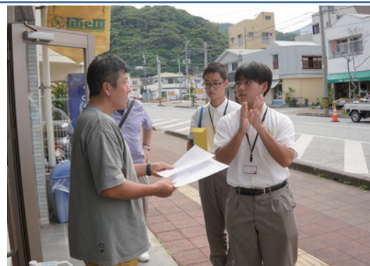
奄ふるプロジェクトの趣旨の説明を商店街の皆様へ直接伺って協力依頼を行いました。

12月3日は、ステージでイベントやお楽しみ抽選会も開催予定です。ぜひ、お越しください。