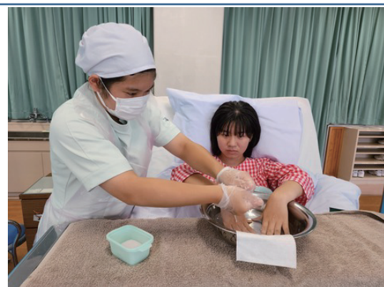
緊張している様子が伝わってきますね！

10月20日には、施設での実習を無事に終えることができました。23日には、校内に戻って、約3週間にわたる実習のまとめをしました。実習を通じて、高齢者の特徴や援助の実際、また施設の役割や他職種連携など多くのことを学ぶことができ、それらをクラスメイト同士で共有しました。