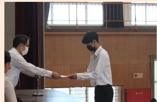
男子バレーボール 準優勝