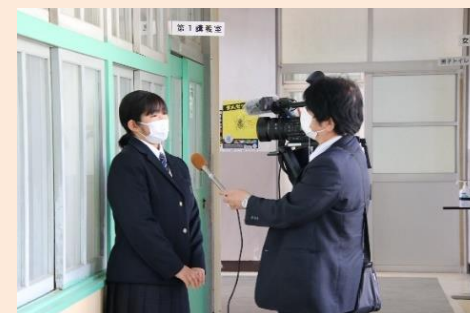
テレビ局の取材も来ました