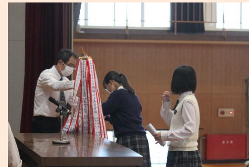
女子ソフトテニス 団体優勝