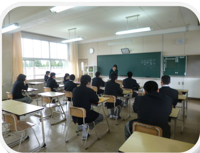
↑初日の様子(就職コース)

5分間テストも始まりました。昨年に続き、満点賞も準備しています。100点を取り続けた生徒に毎学期進路室より表彰しています。それぞれのペースで励んでください。