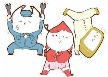
令和6年度 県立隼人工業高等学校 中学生一日体験入学 部活動体験実施一覧