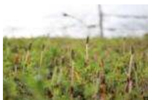
3月19日ツクシ 正門前バス停の土手