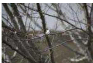
3月17日ソメイヨシノ 開花体育館近く