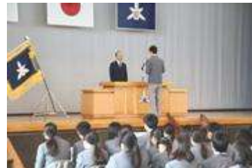
同窓会入会の挨拶