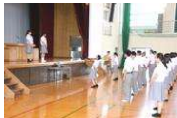
インターハイ・総合文化祭出場の 壮行会のときのようす

梅雨が明け、蝉の音が聞こえるなか、1学期の終業式が行われました。しっかり1学期の反省を行い、充実した夏休みを送ってください。なお3年生は、この夏休みに進路先を決め、一生懸命に受験対策をしましょう。1・2年生は、部活動や勉強に励んでください。