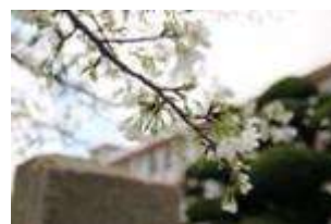
3月19日オオシマザクラ 亡師亡友の碑近く