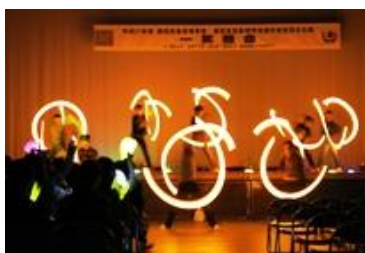
ヲタ芸を極めた3-3男子