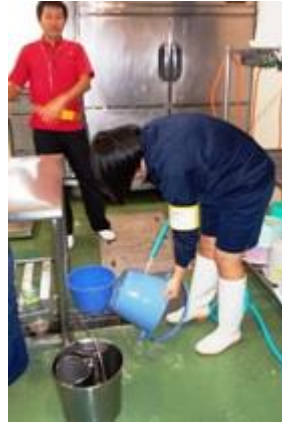
かごしま水族館様