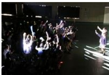
幕間を盛り上げた MC コンビ