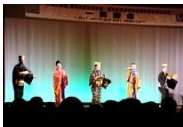
両校職員による琉球舞踊