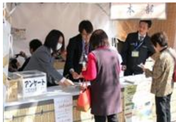
十字屋 cross 様 (イベント)