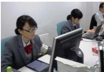
メディアシステム様 様

11月17日(火)から3日間、1年のインターンシップが行われました。本校において1年のインターンシップは初めての試みでしたが、2年と同様に受入先の事業所探しから打合せまで各自で取り組み、どの生徒も充実した3日間を過ごすことができたようです。2年時にもインターンシップを行う予定ですので、あわせて今後の進路決定の貴重な体験にしてほしいと思います。今回本校生徒を受け入れていただいた事業所の皆様、お世話になりありがとうございました。