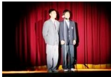
両校の文化祭実行委員長