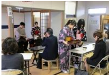
お茶は心が落ち着きます