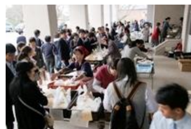
大盛況の両校PTAバザー