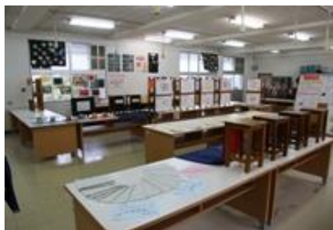
充実の家庭科・家庭クラブ