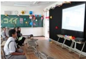
1-2はバカッコイイ動画