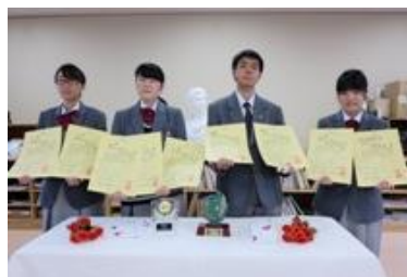
入賞・入選した美術部 員