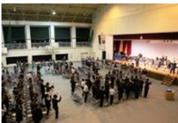
吹奏楽部の演奏で総立ち