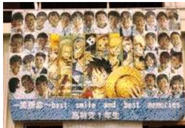
巨大作品は高特支1年