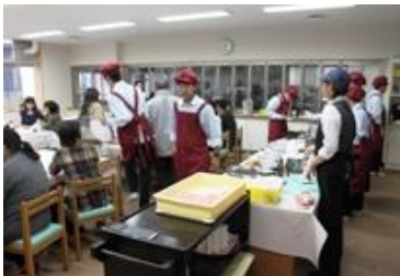
高特支の青空カフェも人気