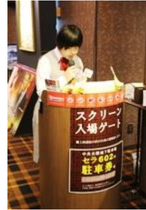
天文館シネマパラダイス様