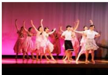
魅了したダンス部の演技

文化祭テーマの通り、笑いあり真剣さありの記憶に残る素晴らしい文化祭でした。保護者の皆様もバザーへのご協力やご観覧いただきありがとうございました。