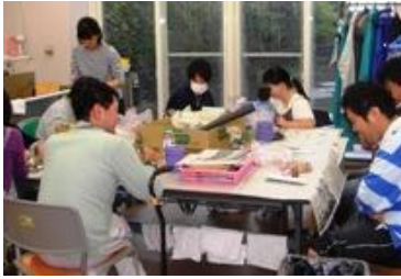
麦の芽福祉会すばる様