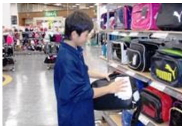
スポーツデポ宇宿店様