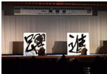
書道部によるオープニング

小雨が降り肌寒い天気の中、「一笑懸命～Best smile and best memories～」をテーマとした高等特別支援学校との合同文化祭が行われました。