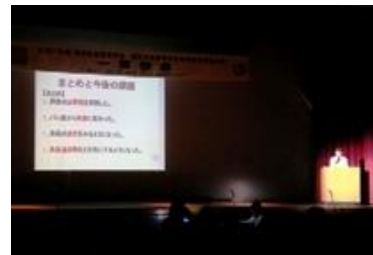
家庭クラブの研究発表