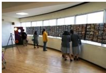
写真部は行事写真の展示