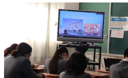
聞き入る後輩たち

進学4人・就職4人の計8人の3年生が、それぞれの体験をもとにして、準備・受験・これからの心構え等について語ってくれました。言葉以上のメッセージが後輩たちに伝わったと思います。