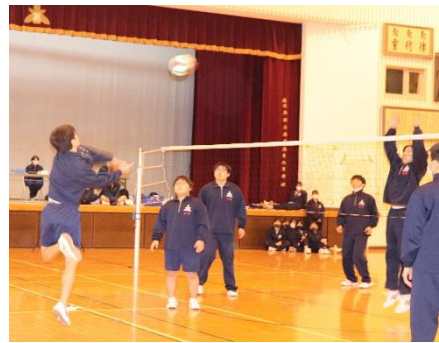
男子バレーボール

12月の寒い時期でしたが、体育館全体を十分に換気し、使用する道具(ボール・ラケット)は消毒を徹底する等、色々な点でいつもとは違っていました。生徒達はいつものように楽しんでいました。