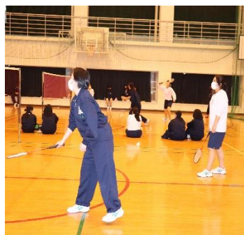
女子バドミントン

新型コロナウイルスの影響で、様々な学校行事が短縮・中止となる中で、換気・消毒・応援方法・試合時間・組合せ等について、十分な感染対策を講じて、2学期のクラスマッチを実施することができました。