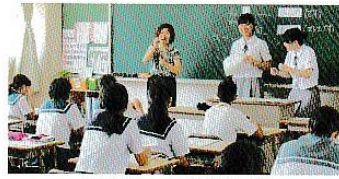
中学生一日体験入学

*PTA親子清掃・体育祭・文化祭・寺山遠行は 鹿児島高等特別支援学校との合同開催