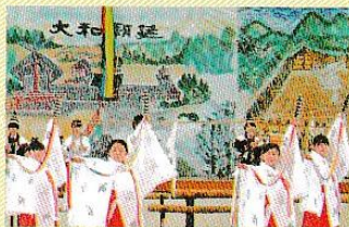
ダンス部(せはる隼人舞)