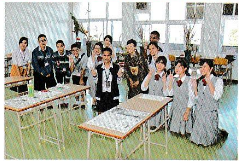
高校生4カ国サミット

本校は昨年、創立70周年を迎えました。卒業生も1万人を超え、各方面でさまざまな活躍をされています。下の写真は、創立70周年記念事業の様子です。