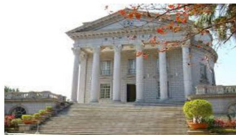
(大同大学尚志教育記念館)

◆学科：総合科・普通科・機械科・電子科・資料処理科。◆千葉県の高校では、平成29年5月16日（火）に、台湾・台北市私立大同高級中学からの訪問団との交流を行いました。これは、千葉県が国際的な視野を持つ人材育成等を目的として行っている海外からの教育旅行の受入れの一環として実施したものです。当日は、台北市私立大同高級中学の吹奏楽部員を中心とする生徒22名・引率教員2名等計27名の訪問者をお迎えし、1年理数科クラスの生徒とともに英語の授業を体験したり、茶道体験、さらに昼食を一緒にとりながらの歓談など活発な交流が行われました。◆【台北市私立大同高級中学 (Tatung High School)】総合科・普通科・機械科・電子科・資料処理科をもつ全日制高校で、『大同公司』（家電製品を中心とする製造販売業）の経営者が創設した工業学校を前身としており、企業による豊富な実務経験の場の提供による現場主義が教育の特徴となっている。