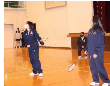
↑ シャトルの行方は?