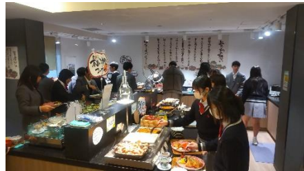
↑ ホテルの食事はバイキングです