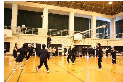
↑ 男女ともにバレーボールは盛り上がりました