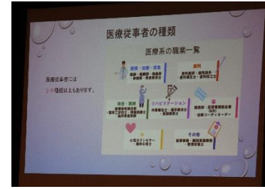
↑ パワーポイントはお手の物です

1月19日に総合的な学習の時間の発表会がありました。コロナ禍の影響で4年ぶりの体育館での開催でした。3年生が半年かけて調べたことを7つのテーマで堂々と発表してくれました。