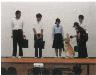
7/6 薬物乱用防止教室

7月20日(木)に出前授業が実施されました。スマート農業やジビエなどの研究についての紹介とともに、大学進学を目指すには、小論文や面接対策等のほか、自分の興味ある分野を極めておくことも大切だということを学びました。