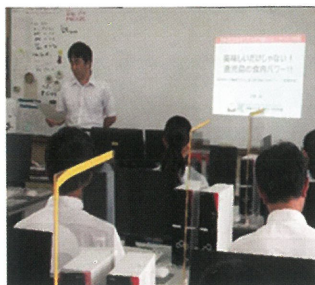
7/20 鹿大農学部出前授業