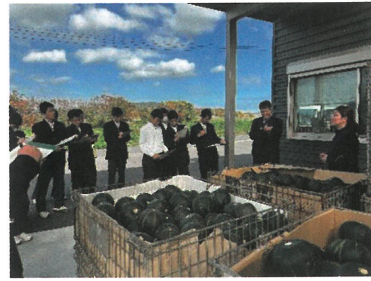
【大吉農園出荷用カボチャ】

★1年農業科は指宿市で露地オクラのIPM栽培とキヤバツ等を海外輸出している農園を視察しました。天敵昆虫の利用やGAP認証等新たな学習ができました。