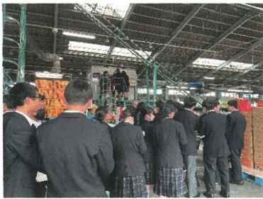
【JAさつま選果場を体感】

★1学年全体での研修では、JAさつま日置北中部営農センター(選果場)・鹿児島県立農業大学校・フレッシュ吹上を視察し、充実した研修となりました。