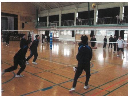
【クラスマッチの様子】

3年生にとって、高校生活最後のクラスマッチとなりました。雨天の影響により男女ともバレーボールを行いました。各クラス一丸となつて優勝を目指し、どの試合も白熱したものとなりました。男子は3年畜産科主体の農薬科・環境園芸科の混合チーム、女子は2年環境園芸科が優勝しました。