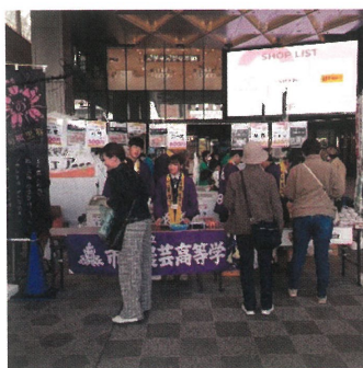
【黒豚フェアの様子】

発し、県内の養豚業等畜産業の活性化に寄与することを目的として開催されました。今回で2回目の開催となり、センテラス内にある店舗(いとこどり)とのランチメニュー商品開発も大変好評でした。消費者への接客や他校との交流ができる学びの機会となり、生徒からも「楽しかった」との声が多く聞かれました。