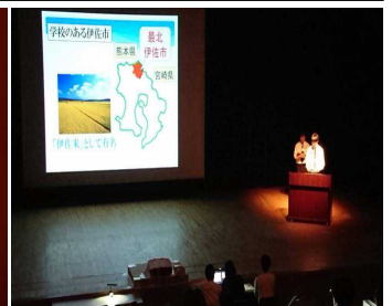
<プロジェクト発表>