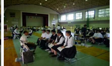
<進路ガイダンスの様子>