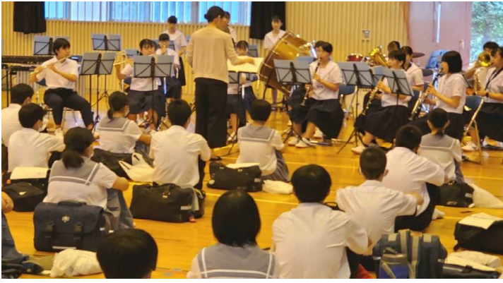
吹奏楽部の演奏で全体会がスタート

七月三十日(金)に、中学生一日体験入学と保護者説明会が開催され、多数の皆さんが参加しました。今回はその様子を紹介します。