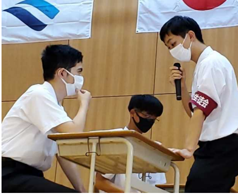
生徒会役員による劇(全体会)

今回から、全体会の企画や運営は、すべて生徒が担当しました。生徒会や放送部が中心となって、映像や劇によって出水高校の生活を紹介しました。体験授業や部活動体験では、皆さんが実際の高校の雰囲気を感じました。