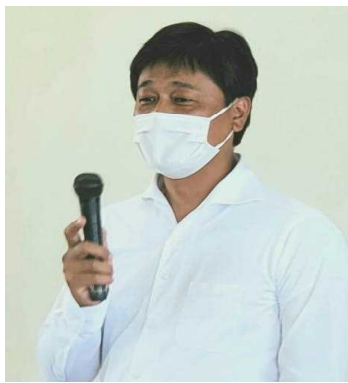
P T A会長からもメッセージ

体験授業の時間には、保護者説明会が同時開催されました。本校で一番大きな教室がほぼ満員になるほど、たくさんの保護者の方に参加していただきました。