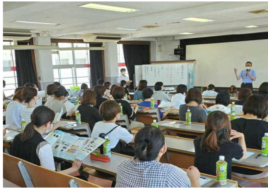
大教室がほぼ満員に(保護者説明会)

今回から、全体会の企画や運営は、すべて生徒が担当しました。生徒会や放送部が中心となって、映像や劇によって出水高校の生活を紹介しました。体験授業や部活動体験では、皆さんが実際の高校の雰囲気を感じました。