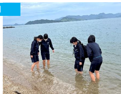
2学年 北薩広域運動公園