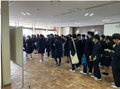
〈試験室へ向かう本校生〉