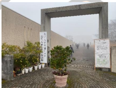
〈試験会場の鹿児島純心大学〉