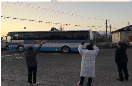
〈午前7時5分 バスで学校出発〉

化学が日々題のおかげでできた。前日、当日は無理しすぎないようにし、気を張りすぎないようにいつも通りを心がけた。ホール内や試験会場がかなり暑かった。体調管理には気をつけるべき。