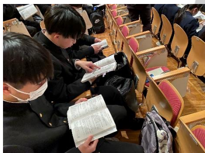
〈試験直前まで確認〉