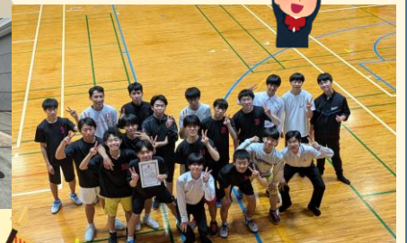
バドミントン部 男子個人戦ダブルス優勝