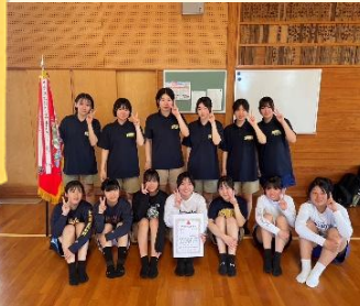
男女バスケット部 優勝

GW明けの5月8日(木)、9日(金)を中心に春季地区大会が開催されました。本校生の活躍の一部をご覧ください。