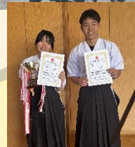
弓道部 女子個人優勝