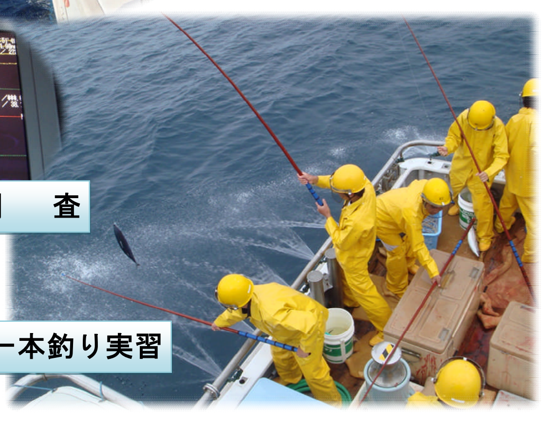
かつお一本釣り実習