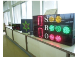
過去の課題研究作品