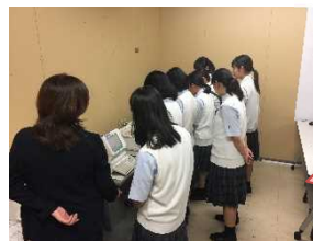
レジ研修にも参加

さらに、3年生の女子4名が枕崎市の菓子店ロイ・コウベさんと共同開発した「マーブルいも cha タルト」も新発売。見た目だけでは伝わらないおいしさを、試食によって感じていただき、約100個を販売できました。今回、販売をするにあたってレジ研修や接客についての研修もあり、開店前の朝礼やお客様のお出迎えなど、実践的な経験をさせていただきました。高校卒業後の進路選択の糧にしたいと思います。