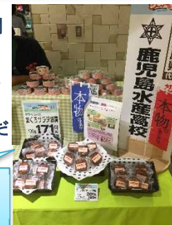
南薩摩の特産品がつまったマーブルいも cha タルト