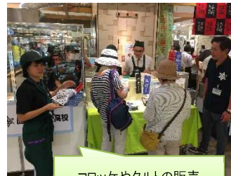
コロッケやタルトの販売