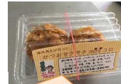
かつおサクサク mini コロは二日連続で買い求める方も！

また、昨年度ジュニア料理選手権で準グランプリを受賞した「かつおメンチのばくだんコロッケ」を冷凍食品にし、「かつおサクサク mini コロ」という商品名にして実演販売しました。