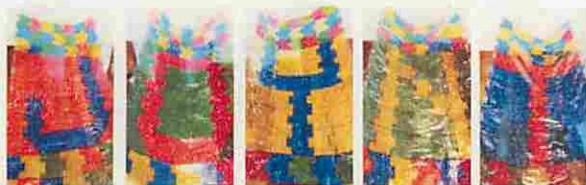
～生徒会企画 ステンドグラス風 文字幕～

平成27年12月5日(土)第16回開陽祭が開催されました。今年、JOY(楽しみ)ながら、JOINT(つながる)ことを大切にしたいとの願いが込められたテーマのもと、各団体が展示・即売、舞台発表、食物バザーを行いました。少ない人数ながらもみんなで協力して思い出に残る一日となりました。