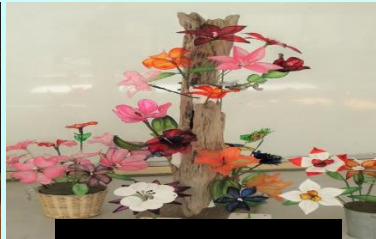
アメリカンフラワー

本校ではものづくり部をはじめ、各学科も様々な製作活動を活発に行い、地域貢献の1つとして作品の寄贈を行い地域の方々に喜んでいただいています。科目「課題研究」では企業との協働活動や作品製作も行っています。今年度も地域の様々な施設などへ作品をお届けしました。