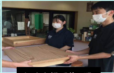
加治木饅頭蒸し器