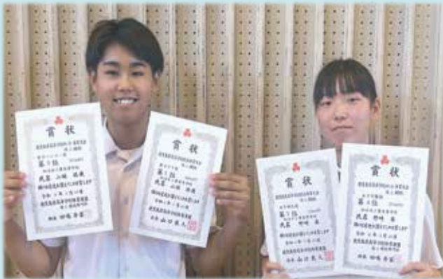
祝！ 国家技能検定試験 3 級 全員合格